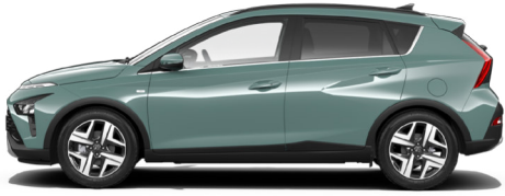
Mangrove Green Pearl Kontrastdach verfügbar