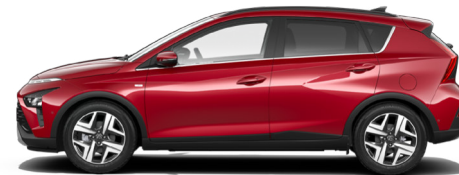
Dragon Red Pearl Kontrastdach verfügbar