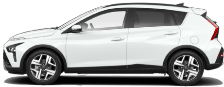
Atlas White Kontrastdach verfügbar