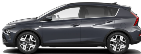
Aurora Gray Pearl