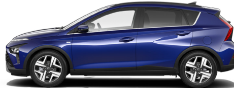
Intense Blue Pearl Kontrastdach verfügbar