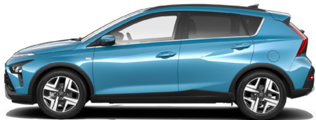
Aqua Turquoise Metallic*